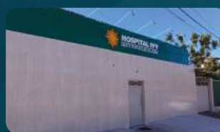
INSTITUTO HOSPITAL VOLTA VIDA