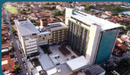
HOSPITAL Haroldo Juaçaba