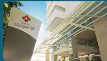
HOSPITAL São Camilo - Cura D'Ar's