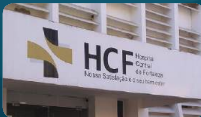
HOSPITAL Central de Fortaleza (HCF)