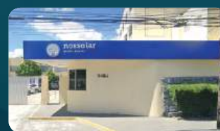
HOSPITAL NOSSO LAR